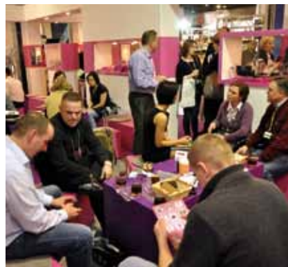
Vorbild: Kontaktplattform RemaDays Warschau